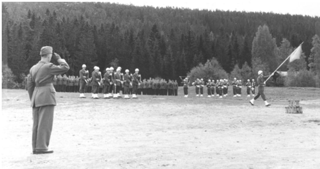
Kårchef, standarvakt och musikkår