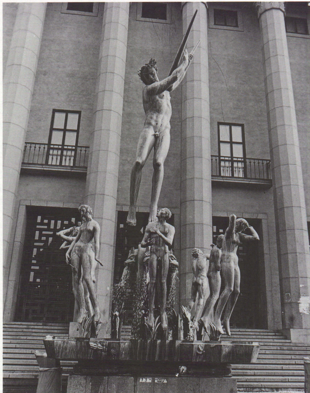
Orpheusfontänen av Carl Milles (1936) framför Stockholms konserthus.