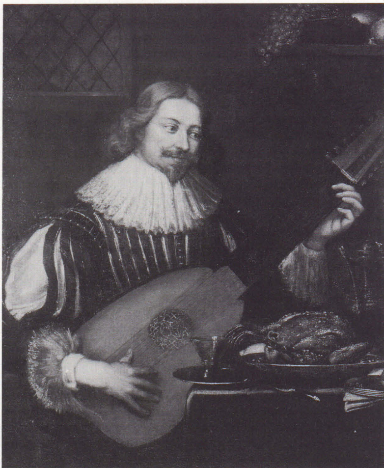
Lutspelände adelsman från 1600-talet (okänd konstnär).