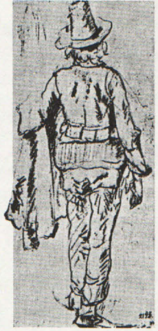
Ill.: Djäkne på vandring. Teckning av J. Ph. Lemke från 1600-talet (Nationalmuseum).

Repertoaren som spelades under 1600-talet var med få undantag inte svensk. De tryckta musikalien som införskaffades till Sverige tillhörde den europeiska standardrepertoaren med verk tryckta av de sedan 1500-talet expansiva musikförlagen i främst Italien, Nederländerna och Tyskland (s. 281 f.).